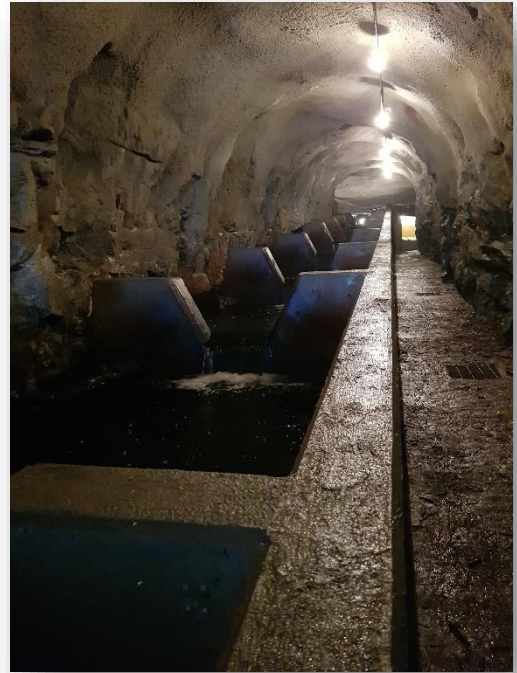
Laksetrappen I Kvåsfossen.