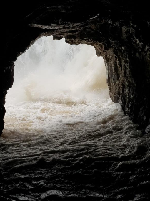
Tunnelåpningen der laksen kommer inn i trappa. Fossen buldrer rett utenfor