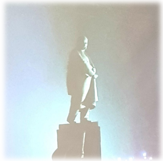
Siste bilde som ble tatt i Ukraina før krigen begynte å «brake» løs.