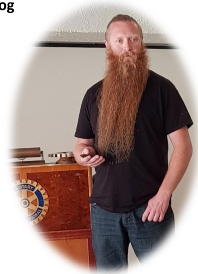
Tusen takk VIDAR, en sterk historie og opplevelse!