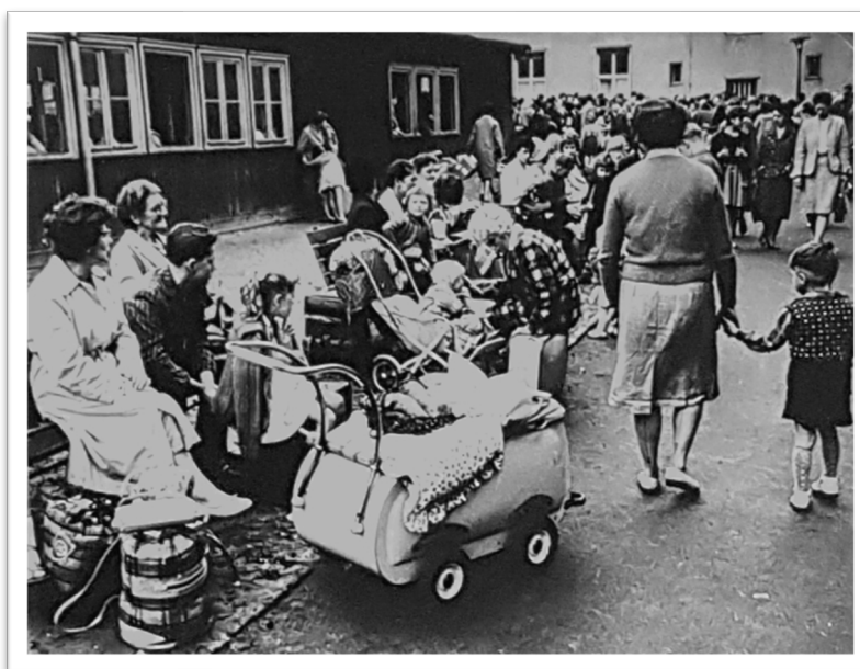
Barna blir møtt av sine familier