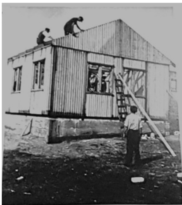
Fritjof Nansen-huset i Ratekau reises etter initiativ fra Redd Barna i 1948. Det var et daghjem beregnet på flyktningbarn.