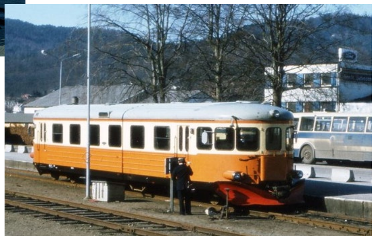
Svenske-toget, kjøpt fra Sverige, ble tatt i bruk da NSB ikke ville vedlikeholde de gamle røde togene.