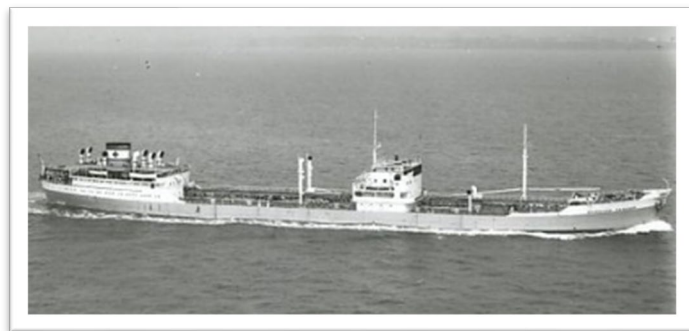
M/T Bernhard Hanssen. Bernhard Hanssen Rederi, Flekkefjord