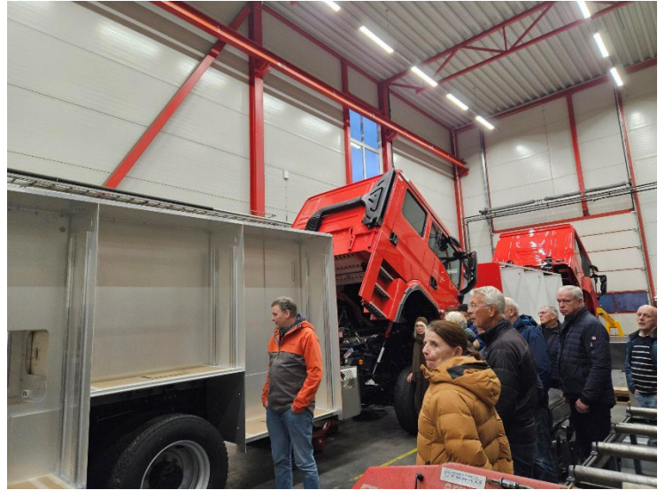
Karosseriet er klart til at innredningen kan begynne